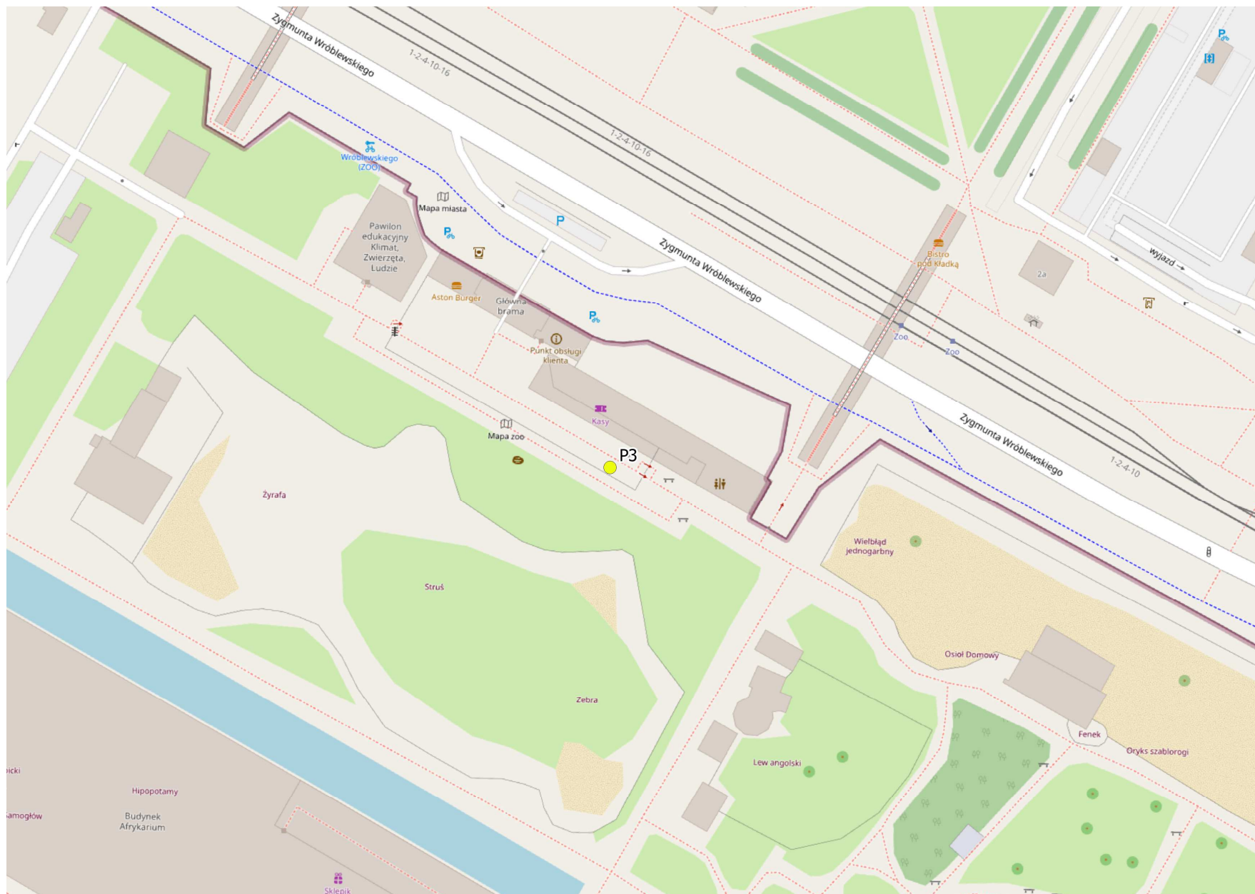
Załącznik nr 1 do sprawozdania nr A-2019-07/006 (lokalizacja punktu pomiarowego).